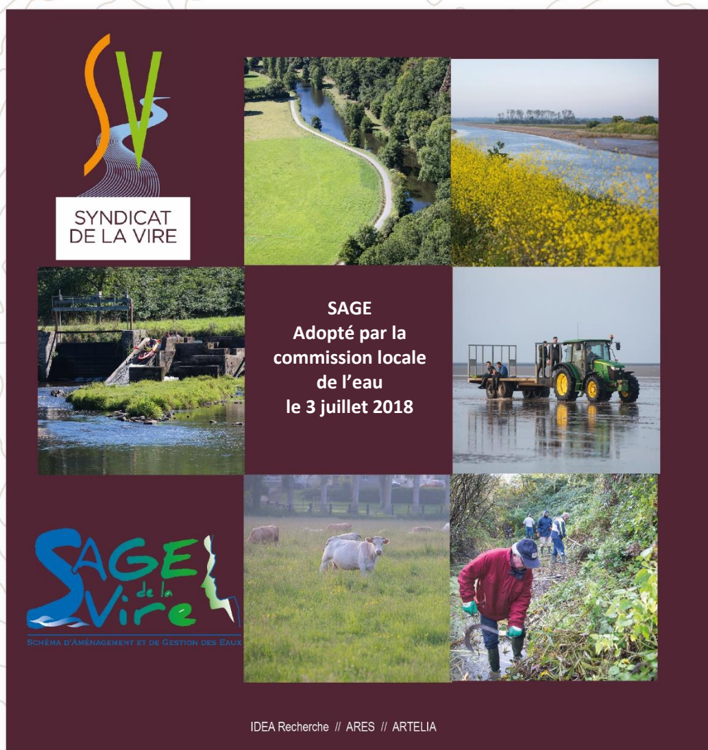
Schéma d'aménagement et de gestion des eaux de la Vire